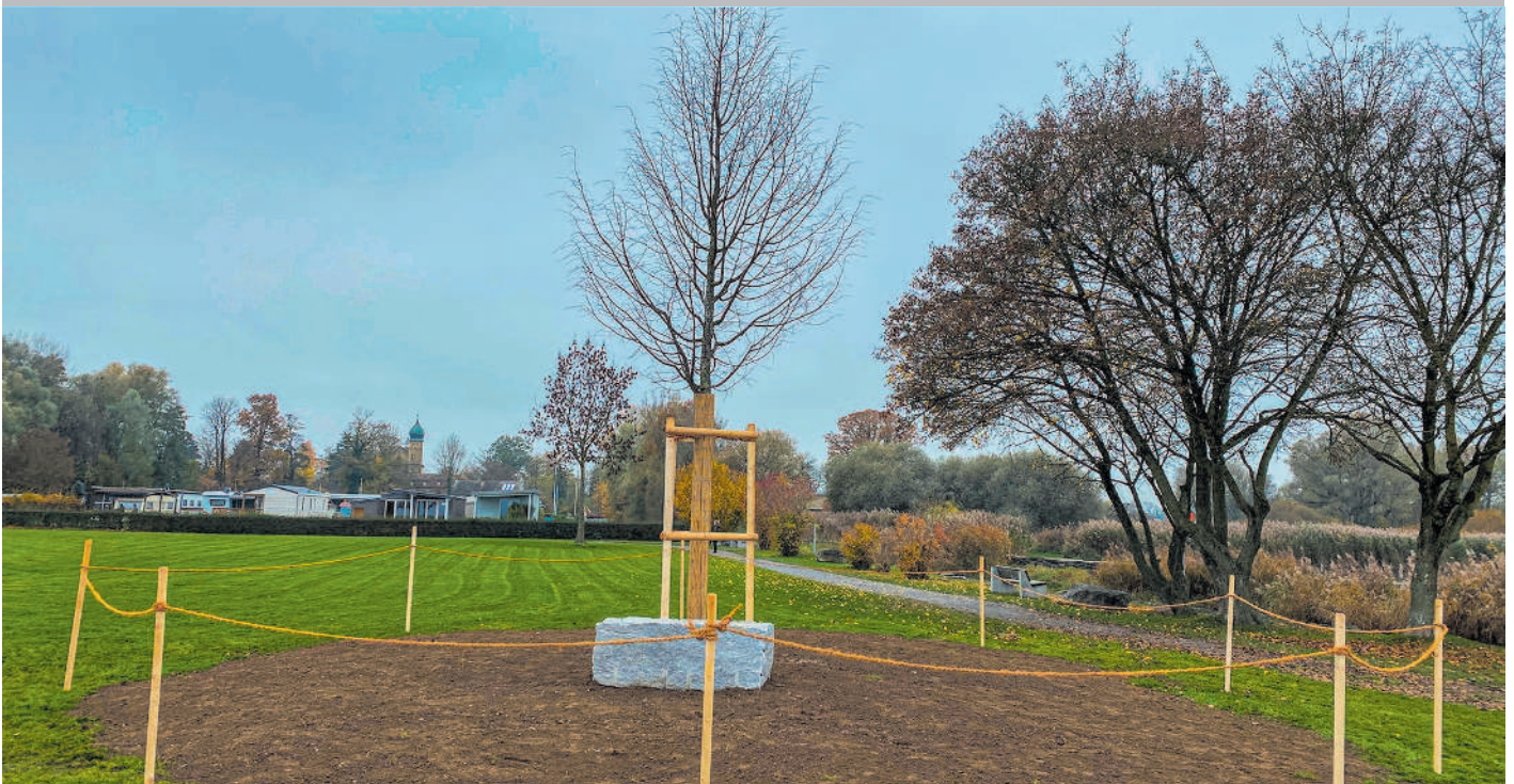
Die durch den Männerchor neu gepflanzte Jubiläums-Linde auf dem Badeplatz Luxburg.

GZA 9315 Neukirch (Egnach) KW 46, 13. November 2020 Amtliches Publikationsorgan der Gemeinden Egnach, der Evangelischen Kirchengemeinde Egnach, der Katholischen Kirchengemeinde Steinebrunn und der Volksschulgemeinde Egnach