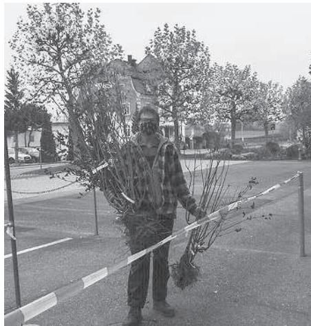
Abgabe der Ersatzpflanzen beim Werkhof Egnach.

Deshalb wurden die Egnacher Gärtnerinnen und Gärtner dazu aufgerufen, ihre Sommerflieder, Kirschlorbeer & Co. auszureissen und mit Pflanzen zu ersetzen, die für die einheimische Tierwelt wertvoll sind und damit zur Biodiversität in unserer Gemeinde beitragen. Die Ersatzpflanzen wurden, gegen Beweisfotos der ausgerissenen Pflanzen, gratis abgegeben. Am letzten Samstag war es so weit: 14 Naturbegeisterte konnten insgesamt 56 Jungpflanzen in Empfang nehmen. Als Gegenleistung wurden hauptsächlich Kirschlorbeer und Sommerflieder aus den Hausgärten entfernt. Dafür werden nun Mönchspfeffer, Pfaffenhütchen, Kornelkirsche, Wolliger Schneeball, Hainbuche, Gemeiner Liguster, Schwarzer Holder, Weinrose, Eibe, Haselnuss und Johanniskraut die einheimischen Vögel und Insekten erfreuen und die Vielfältigkeit der Egnacher Flora bereichern.