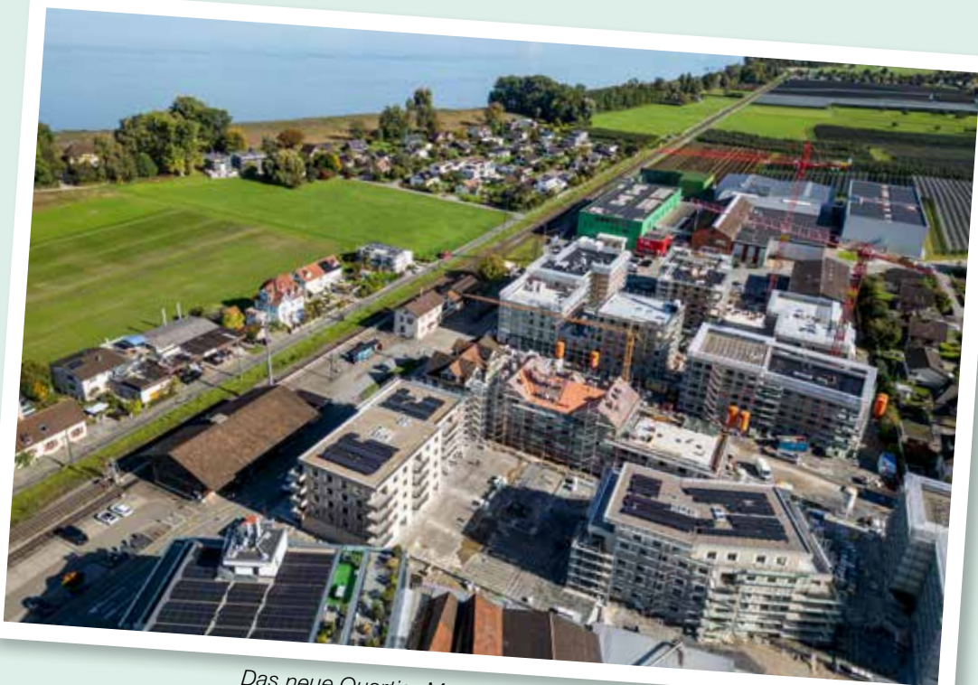
Das neue Quartier Mostereiplatz und links das Luxburgerfeld in Egnach

Alle Detailinfos sind auf der Onlineversion einsehbar