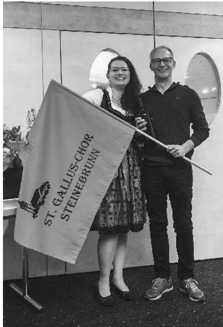
Jubiläumsgeschenk – erste Vereinsfahne St. Gallus-Chor Steinebrunn

Mit dem Ausblick ins neue Jahr wird klar: Auch im Jahr 2023 steht einiges auf dem Programm. Der St. Gallus-Chor wird an Ostern die Uraufführung der Thurgauer Jubiläumsmesse singen, und am 22. Oktober wird am Gallusfest der Jubiläumsgottesdienst des Chores stattfinden. Das Jubiläumsjahr wird aber auch geprägt werden durch einen Tages-